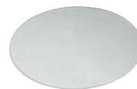
Filtro frost "90" Frost filter "90"