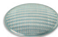
Filtro ovalizzatore Ovalising filter