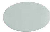
Filtro frost "400" Frost filter "400"